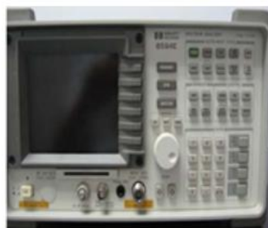
HP 8594E 频谱分析仪